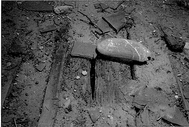
A fedélszék és fa zárófödém a beázások és szuvasodás következtében károsodott