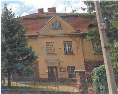
A Széchenyi utca felől