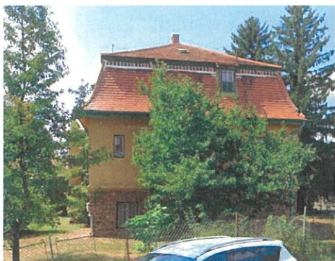
A Petőfi utca felől

Az épület egy cca. 100 éves szabadon álló épület. Az épület eredetileg egy polgári villa lehetett, később az MHSZ épületeként szolgált Jelenleg használaton kívül van.