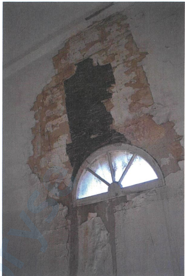
A beázások a belső terek határoló szerkezeteiben jelentős károkat okoztak