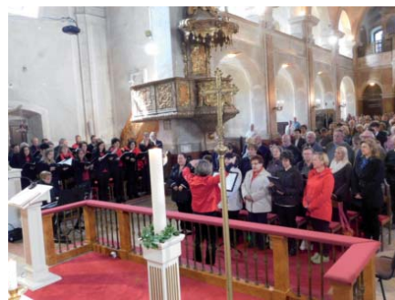
Bárdos Lajos Tábortűznél című népszerű kórusművét.