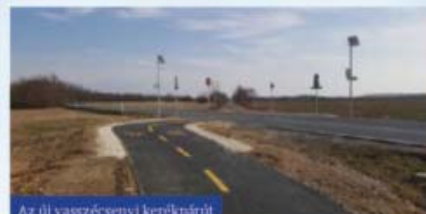
Az új vasvárcsényi kerékpárút