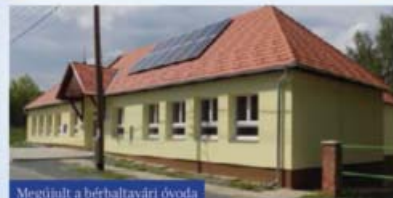
Megújult a bérbaltavári óvoda