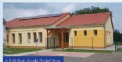
A felújított óvoda Nyögérben