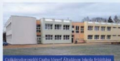
Csalkánydoroszlói Csaba József Általános Iskola felújítása