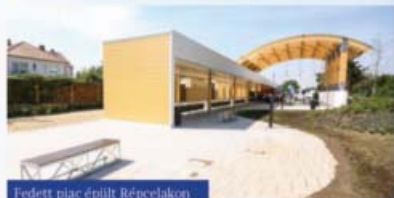
Fedett piac épült Répcelakon