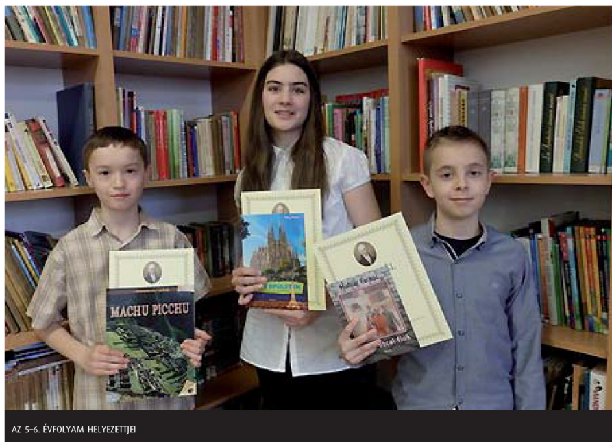
AZ 5-6. ÉVFOLYAM HELYEZETTJEI