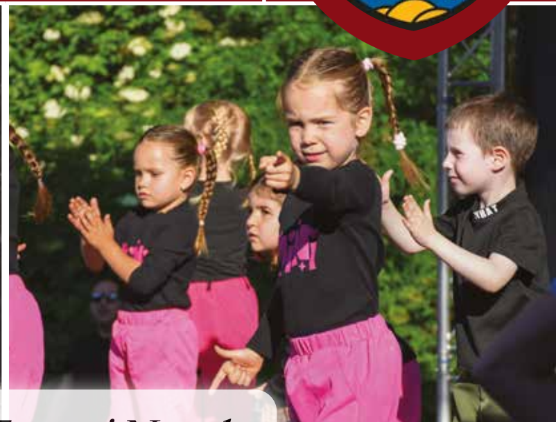
Alsósági Tavaszi Napok