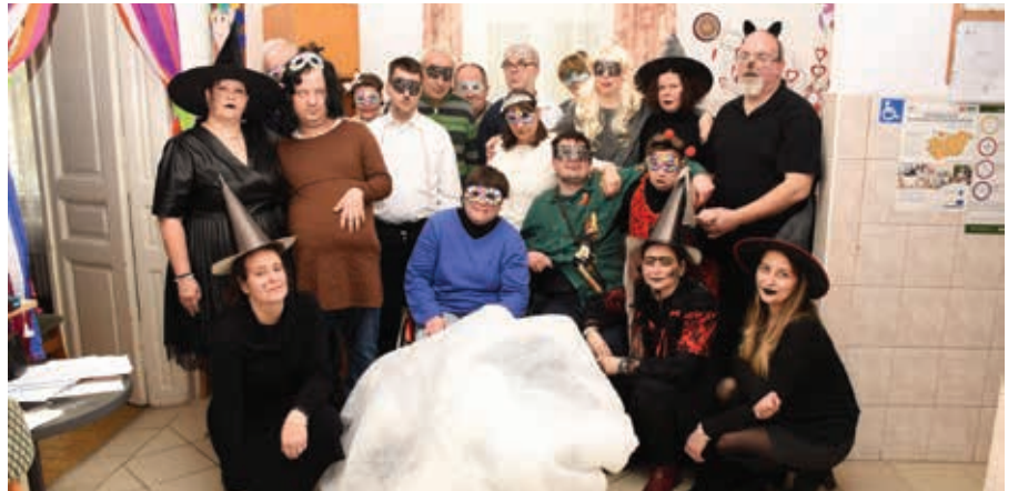
Népjóléti Szolgálat - Nappali Támogató Központ farsangja

Farsang. Egy ünnepkör, mely mindenkinek mást jelent. Valakinek a nagymama fánkját zamatos házi lekvárral tálalva, valakinek a tradíciók fontosságát, másoknak a vidámságot és a jókedvet, melyet bálokkal alapoznak meg. Ebben az időszakban jelmezt ölthetünk és néhány óráig azok lehetünk, akik csak akarunk. A vízkeresztől nagybőjtig tartó időszak hazánk egyik legtöbb hagyománnyal bíró ünnepkörét rejti magában. Számtalan rendezvény, program kapcsolódik ehhez, melyekből Celldömölkön sincs hiány. Minden év februárjában farsangi han-