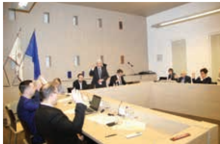
Celldömölk Város Önkormányzatának Képviselő-testülete munka közben

Az önkormányzat egyik legkiemelkedőbb feladata minden évben a költségvetés megalkotása. Hosszas egyeztetések után a testület február 12-ei ülésén fogadta el Celldömölk 2025-re vonatkozó pénzügyi tervét.