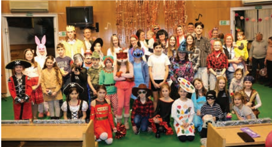
A Zeneiskola farsangi csoportképe

felkészültségükkel, szép muzsikájukkal örvendeztették meg a közönséget; másrészt pedig iskolánk nevelőtestülete, akik kicsit kibújva a hagyományos értelemben vett pedagógusi szerepkörből, fergeteges hangulatot