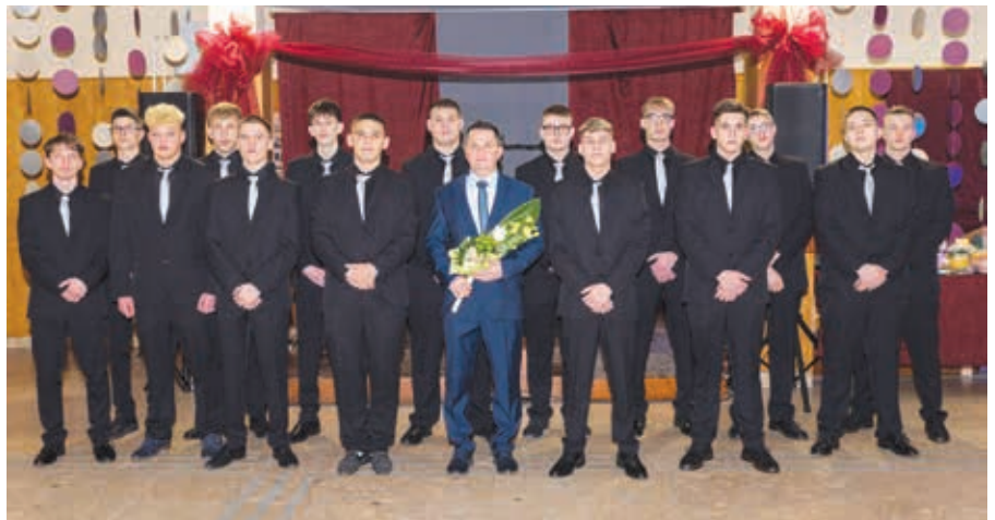
VVSZC Eötvös Loránd Szakképző Iskola 3/11.C osztálya