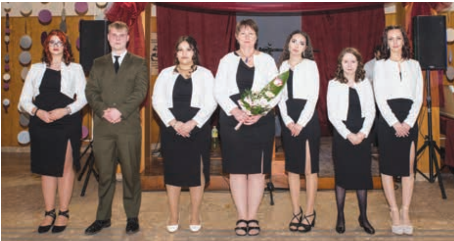
VVSZC Eötvös Loránd Szakképző Iskola 3/11.B osztálya

Szalagot kaptak a VVSZC Eötvös Loránd Szakképző Iskola végzős diákjai. A szalagavató rendezvényt és az azt követő bált február 14-én rendezték meg az intézmény aulájában.