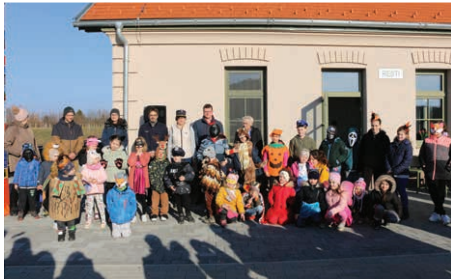
Nemcsak a gyerekek, hanem a szülők is vidám maskarát öltöttek.

Vasárnap délután különféle jelmezekbe öltözött kicsik és nagyok lepétek el a Vasparipa Játszóparkot, igazi farsangi mulatságot varázsolvá ott. A városi télbúcsúztató rendezvényt ez alkalommal a Kemenes Szolgáltató