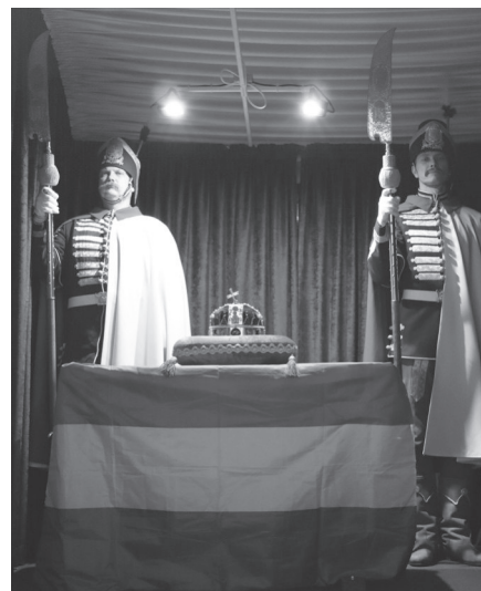
A Szent Korona hiteles másolatát is megtekinthették az érdeklődők.