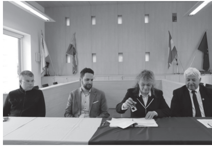
Szerződés-aláírás a Városházán.

A 'Vulkán Gyógy- és Élmenyfürdő Energetikai fejlesztése Celldömölkön' elnevezésű projekt célja a fürdő szén-dioxid kibocsátásának csökkentése úgy, hogy a másodlagos energiaigény ne emelkedjen. Ennek keretein belül két, egymástól elváló, de techno-