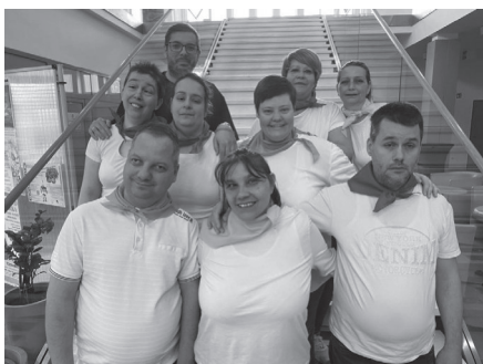
A Népjóléti Szolgálat - Nappali Támogató Központjának vidám csapata a rendezvény megnyitóján.