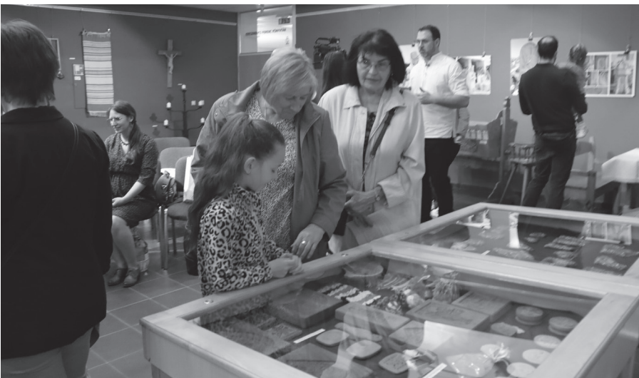
"Élni az idő közepén..." népművészeti kiállítás a KMKK Mórítz Galériáján.

A kreatív alkotási lehetőség délután is folytatódott, hiszen Tulipános kreatív műhely keretében kézműves foglalkozások várták a gyerekeket a Szentháromság téren, ahol gyöngyfüzés - karkötőkészítés, tavaszi ajtó és ablakdísz, csuhévirágok készítése várták az alkotni vágyó kicsiket és nagyokat, a művelődési központ előcsarnokában pedig fazekas foglalkozás zajlott.