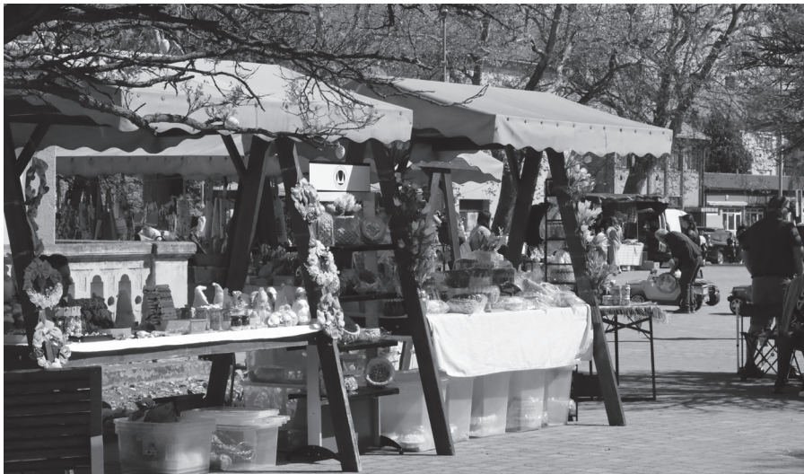
Kemenesi piac a Szentháromság téren

dött a Kenyeri Rábamenti Citerazeneke. Este hét órától a Theatrum Szintársulat foglalta el a szabadtéri színpadot és mutatta be Slágerfesztivál-ját, közkedvelt számokat felsorakoztatva. A slágerkavalkád követően Balázs Pali „Érzések időutazása” című koncertjének lehetett részese a Tulipánfesztivál közönsége, melynek keretében örök klasszikusok, harmincéves pályafutásának legnagyobb slágerei és új dalok egyaránt felcsendültek nosztalgikus és romantikus hangulatot varázsolva a Géfin térre.