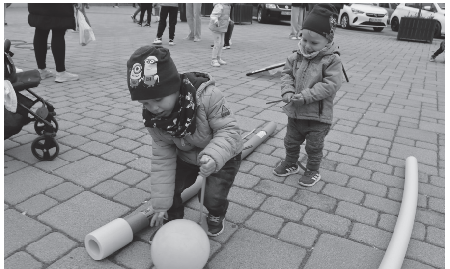
A legkisebbek is élvezték a szabadtéri játékokat.

dobás, ugrókötelezés, karikadobálás, ugróiskola, tépőzárás labda kipróbálása nyújtott lehetőséget egy kis mozgásos, vidám tavaszi kikapcsol-