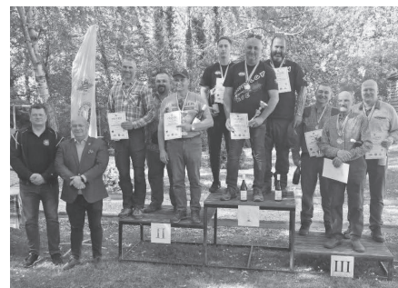
A Szent György Kupa legjobb csapatai.