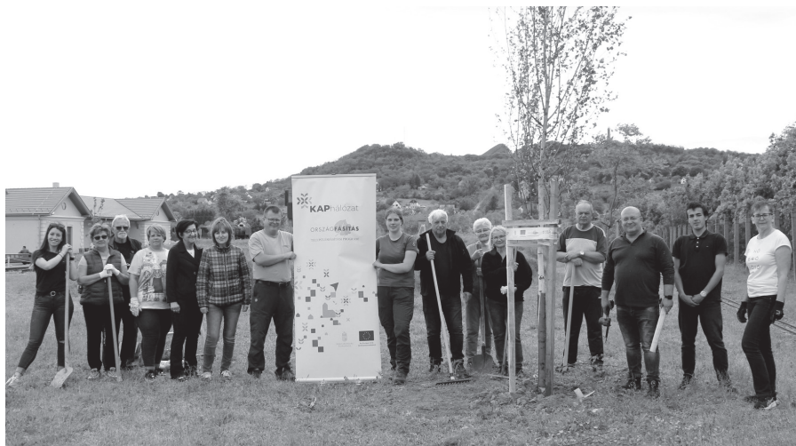
A Vasparipa Játzópark területére is ültettek fákat az Országfásítási program keretében.

társai, a képviselő-testület és a Cselekvő Összefogással Celldömölkért Egyesület tagjai, valamint a VVSZC Eötvös Loránd Szakképző Iskola tanárai, diákjai egyaránt. A szakmai segítséget és iránymutatást az Országos Erdészeti Egyesület munkatársai biztosították. »NFM