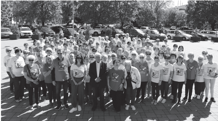
Regionális örömtánc ünnep a KMKK előtti téren.