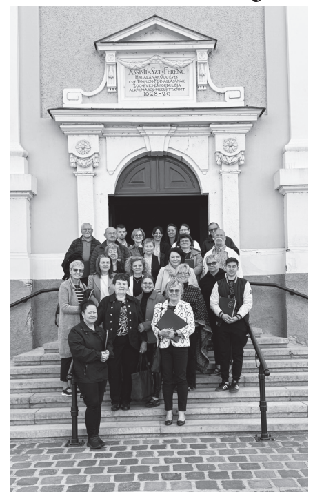
A Celldömölki Liszt Ferenc Vegyeskar tagjai a Pádai Szent Antal Plébánia előtt.