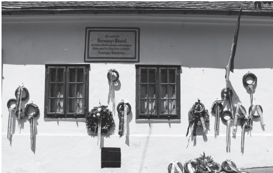
Berzsenyi Dániel Emlékmúzeum Egyházashetyén.

Megemlékezés Egyházashetyén Szülőfalujában emlékeztek meg a költőlegendáról, Berzsenyi Dánielről. Az ünnepséget május 9-én szervezték meg Egyházashetyén a Berzsenyi-ház előtti téren.