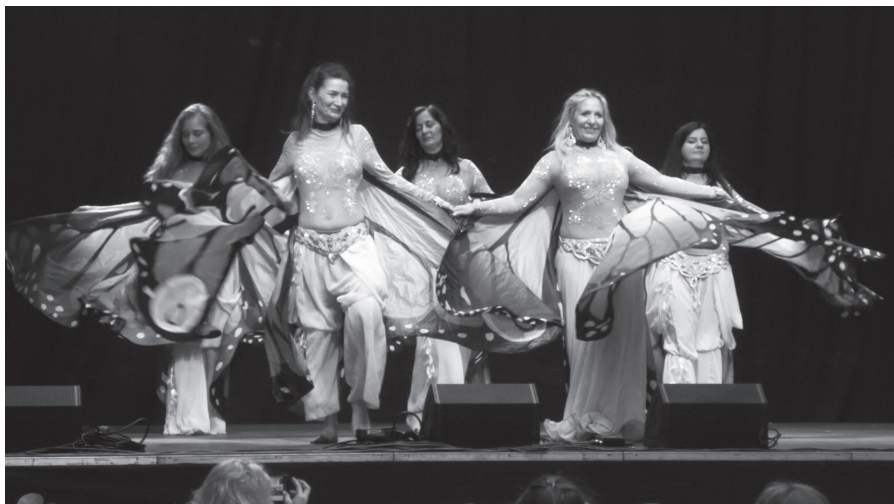
A Mira Orient Art táncosai szórakoztatták a közönséget.