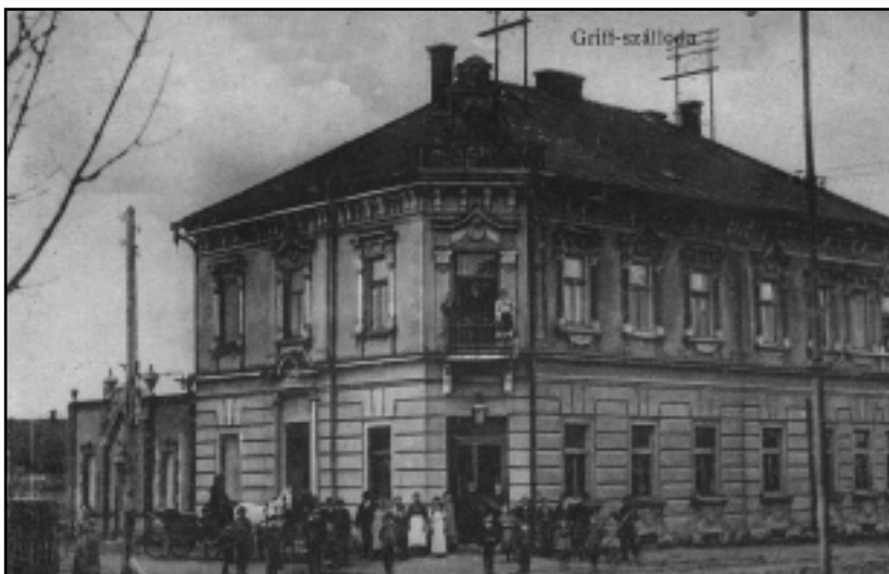
A HAJDANI GRIFF SZÁLLODA