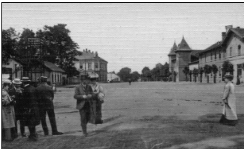
A VASÚTÁLLOMÁS A SZÁZADFORDULÓN

a megemlékezésre. Igen ám, de a község és az egyház 1932-33-ban éves programkeretében már megülte a 800 éves jubileumot, a záró eseményen 1933. szeptember 8-án a celli búcsú napján Serédy Jusztinán hercegprímás is jelen volt. Magas rangú egyházi személyiségek, élükön a hercegprímással, II. (Vak) Bélával hozzák összefüggésbe az apátságot, vagyis