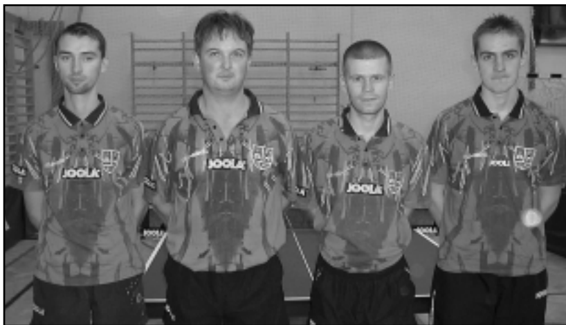
AZ NB II-S CSAPAT