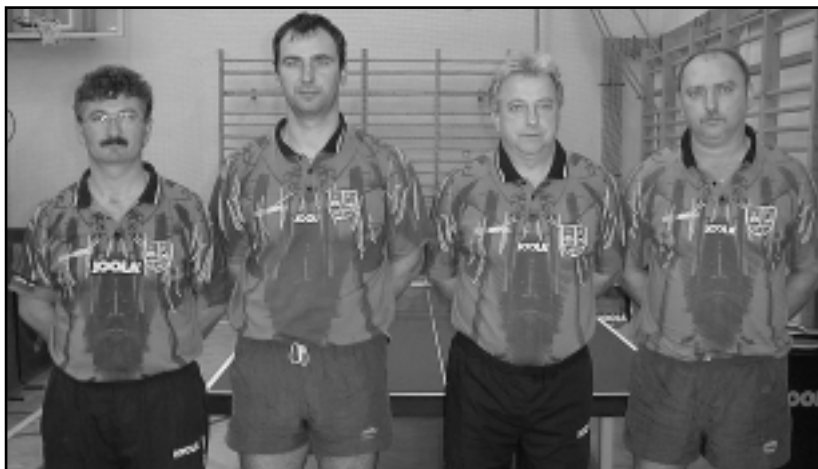
AZ NB III-S CSAPAT