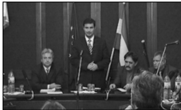
MESTERHÁZY ATTILA A TESTULETI ÜLÉSEN

Az a néhány évvel ezelőtt még nagyon lepusztult celli sporttelep 2004 végére, a sportminisztérium, az önkormányzat és szponzorok anyagi segítségével, a megye egyik legszebb sportcentruma lehet. Van még azonban bőven tenni való. Többek között a gyönyörű füves centerpálya – mely a Kemélyép Kft. munkáját dicséri – teljes „felöltöztetése”, a lelátó korszerű tetőzettel való ellátása, esetleges mélységben való elnyújtása, kiszolgáló helyiségek korszerűsítése, építése, valamint a Bozsik-programban részt vevő utánpótlás csapatok villanyfényvel ellátott kisméretű műfüves pályának megépítése. Természetesen ez a pálya, a már elkészült futó- és ugrópályával együtt, az óvodai és iskolai testnevelést és a felnőtt szabadidős sportot is hivatott lesz elősegíteni. A műfüves pálya felépítéséhez szükséges költség nagyobbik részét az önkormányzat már pályázat útján elnyerte. Ezt tényként jelentette be a december 17-ei testületi ülés napirend előtti felszólalásában, Mesterházy Attila, a Gyermek-, Ifjúsági és Sportminisztérium politikai államtitkára. A bejelentésből tudtuk meg, hogy Vas megye a Bozsik-program pályázatán 86 millió forintot nyert el, s ebből az összegből Celldömölkre 46 millió fog érkezni. 36 millió a CVSE műfüves pályájához, míg 10 millió az UFC 2000 ministadion építéséhez. A