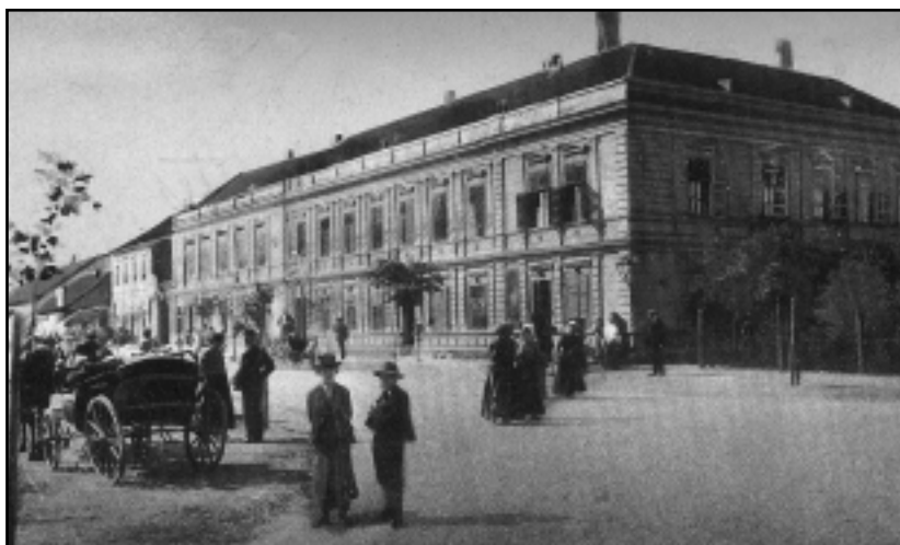
A MA MÁR NEM LÉTEZŐ JÁRÁSBÍRÓSÁG

kénti szavazással egyhangúlag elutasítják. Az adóemelés felemlítésének van-e reális alapja, nem tudni, a kiscelliek tiltakoznak, tagadják. Az