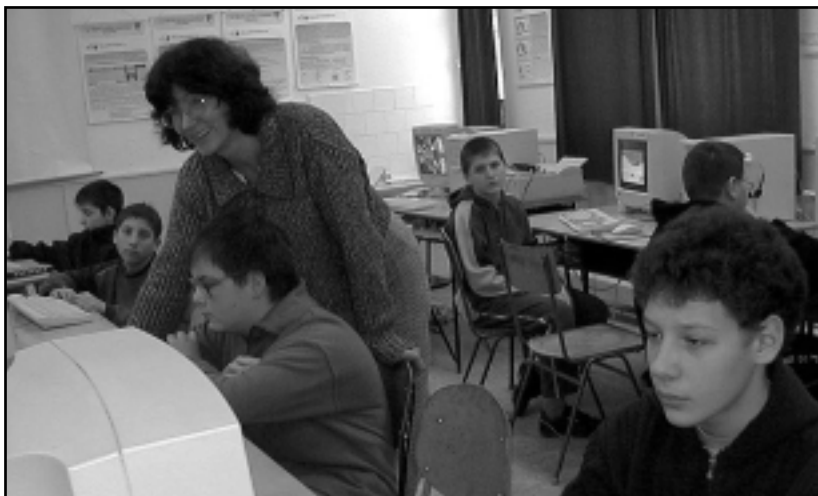
CSOPORTBONTÁSBAN TANULHATJÁK A GYEREKEK A SZÁMÍTÁSTECHNIKÁT

A Berzsényi Lénárd ÁMK elérhetőségei: Levelezési cím: 9500 Celldömölk, Sági u. 167. Tel./fax: 95/420-472 E-mail: blamk@freemail.hu, blamk@cellnet.hu • www.cellnet.hu/blamk