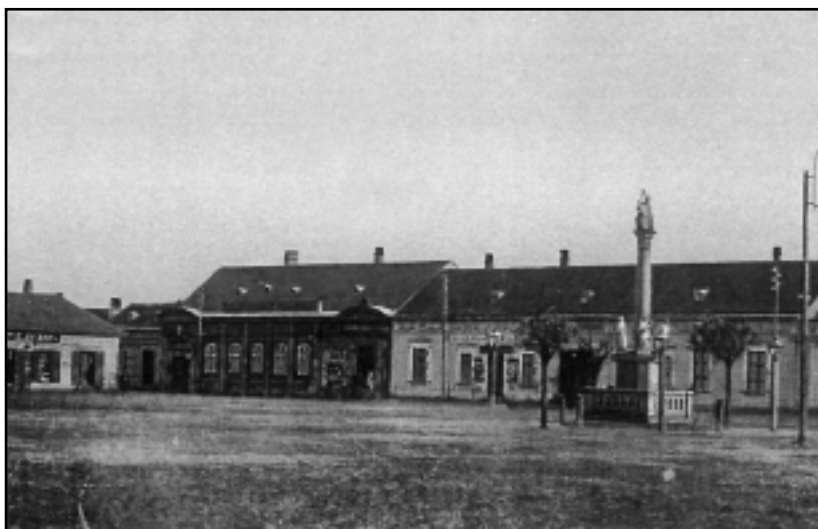
A VÁROS KÖZPONTJA, A SZENTHÁROMSÁG TÉR

A kiegyezés után megindult gazdasági és társadalmi fejlődés hatása jól kimutatható Kemenesalja központi településének életében is. A korábbi mezővárosi rang és a vele összefüggő piacközponti szerep mellett egyre nagyobb vonzást gyakorol távolabbi helyekre azáltal, hogy bővül a fogadókészség, létrejönnek a nagyközség rangját emelő intézmények – bíróság, ügyészség, telekkönyv, pénztézetek, kórház –, a foglalkoztatás szempontjából fontos téglagyárak, a malom, és mindenekelőtt a vasút szerepét kell kiemelni, amely a lakosság egyre nagyobb részének alkalmazásában érdekelt, s nyújt biztos megélhetési forrást. Iskolák épülnek, a szaporodó társadalmi egyesületek is helyet követelnek maguknak. Az igénybe vehető belterületek kimerülőben vannak, a nagyközség vezetőségét évek óta foglalkoztatja a terjeszkedés irányának meghatározása.