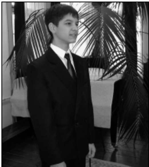
KÉT VERSESEL SZEREPELT A VERSMONDÓK