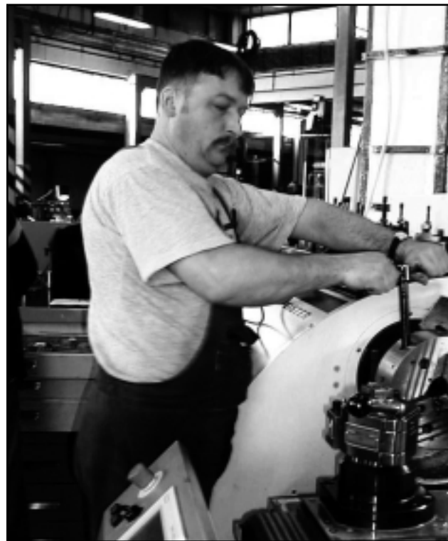
LENDÜLET A TERMELÉSBEN