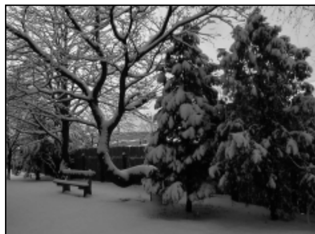
NEM ENGED SZORÍTÁSÁBÓL A TÉL, VÁRAT MAGÁRA A TAVASZ. HÓTAKARÓ BORÍTOTTA A VÁROST MÉG A HÉTEN IS.