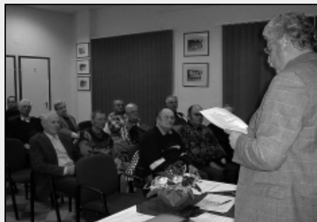
A BARÁTI KÖR A CVSE-NEK SEGÍT

A CVSE Intézőbizottsága méltányolta a Baráti Kör tagságának segítőkészsé-