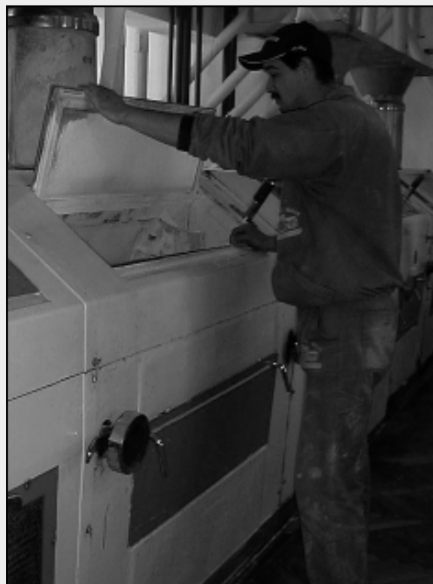
FOLYAMATOSAN ÚJÍTJÁK A TECHNOLÓGIÁT