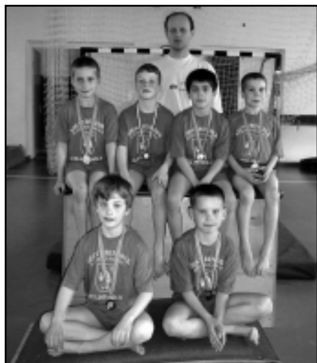
I-II. KORCSOPORT FIÚ TORNACSAPAT