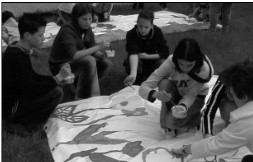
MAGYAR VIRÁGOK EURÓPA KERTJÉBEN – ÓRIÁSKÉPET FESTETTEK A GYEREKEK

A polgármesteri üdvözlés után Kemenesi köszöntő címmel kezdődött a helyi és a kistérségi hagyományörző