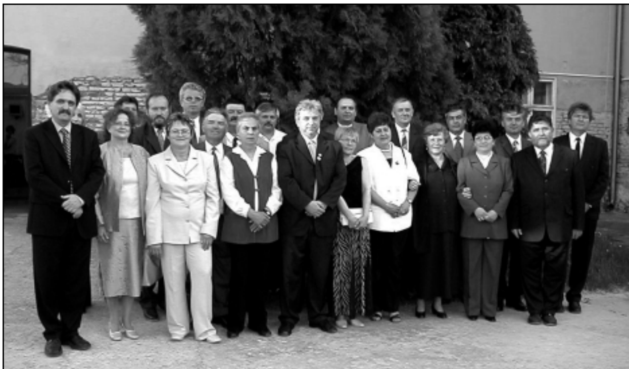
A TÉRSÉG ORSZÁGGYŰLÉSI KÉPVISELŐI, A KEMENESALJAI TELEPÜLÉSEK VEZETŐI A CSATLAKOZÁS NAPJÁN