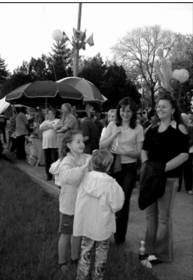
AZ ELSŐ UNIÓS MAJÁLIS

Az Európai Bíróság munkája független a tagállamoktól, csak a közösség érdekeit szolgálja. A Számvevőszék feladata, hogy ellenőrizze, megfelelően költik-e el az Európai Unió pénzét.