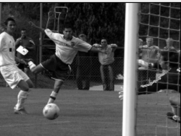
HEGYI REGEDEIVEL CSATÁZOTT