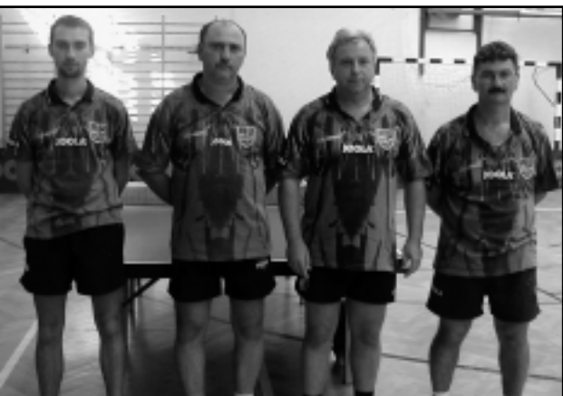
AZ NB II-ES ASZTALITENISZ-CSAPAT

Hat forduló után Izsákfa 8 ponttal a 6., Alsóság 4 ponttal a 9. helyen van a tabellán.