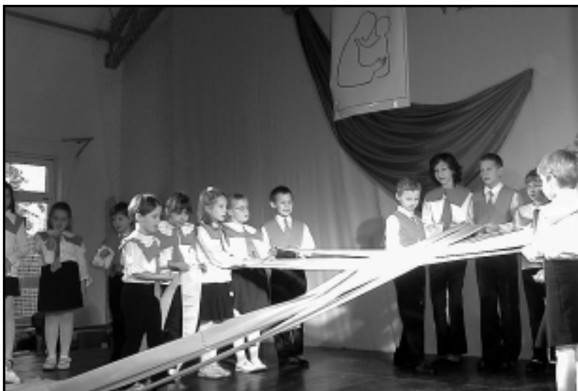
JELENET A GYEREKEK ÜNNEPI MŰSORÁBÓL