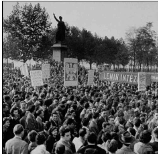
TÖMEG A BUDAPESTI PETŐFI-SZOBORNÁL OKTÓBER 23-ÁN

Október 25-ének véres tragédiája ismét fordulatot hozott az eseményekben. Az Országház elé vonuló tömegbe az ÁVH provokátorai belelőttek, majd a jelen lévő szovjet harcokocsik is tüzet nyitottak. A több mint száz halálos áldozat és sok sebesült látványa tudatosította az emberekben, hogy a régi rendszer csak erőszakkal