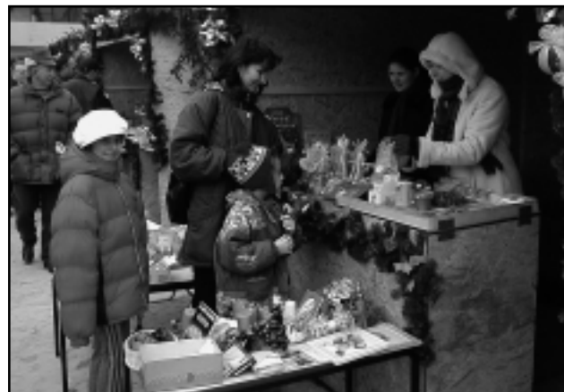
JÓTÉKONYSÁGI VÁSÁRT RENDEZETT A CELLDÖMÖLKI VÁROSÉRT EGYESÜLET