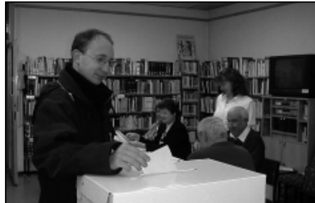
3543 CELLDÖMÖLKI SZAVAZOTT