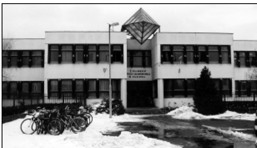
A SZAKKÖZÉPISKOLÁBAN CSOPORTSZÁMOKAT CSÖKKENTENEK