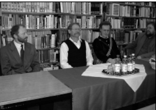
A KÖNYVBEMUTATÓ VENDÉGEI AZ ÖSSZEJÖVETELLEN