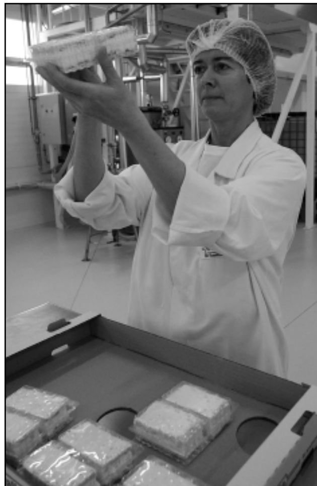
KRÉMES SÜTEMÉNYEKET IS KÉSZÍTENEK