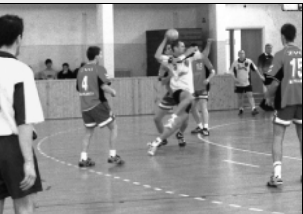
HAT CSAPAT VETT RÉSZT A KUPÁN

A tavalyi évhez hasonlóan az idei téli felkészülési időszakban is megrendezte a Celldömölki VSE férfi kézilabda-