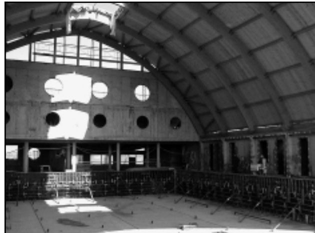
KÉT HÓNAP MÚLVA KEZDŐDHET A PRÓBAÜZEM

A fürdővel egyidejűleg meg kell építeni a parkolót, a létesítményhez vezető utat, a külső közműveket, amelyekre közbeszerzési eljárást írt ki az önkormányzat. A csapadékvíz-elvezető csatornát rövid időn belül építeni kezdi a CellVíz Kft. A gyalogos és kerékpáros utak építését, a közvilági-