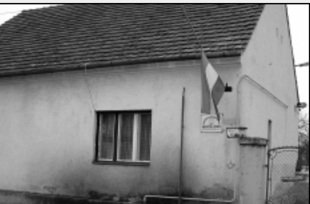
FÉL ÉVSZÁZADA A TEMESVÁRI UTCÁBAN MŰKÖDIK A MENTŐÁLLOMÁS