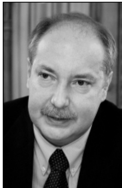
KISS PÉTER KANCELLÁRIAMINISZTER

Örömmre szolgál, hogy az újság hasábjain köszönhetem a város polgárait az új esztendőben. Büszkeséggel tölt el, hogy szülővárosom ilyen sokat fejlődött az elmúlt években. Az idelátogató szinte rá sem ismer a mai Vas megyei településre. A városkép látványosan változott: megépült a körforgalmi csomópont, megújult a főtér, új tetőt kapott a városi katolikus templom, és a nyáron átadtuk a Vulkan fürdőt, amely méltán lehet a város egyik büszkesége. De Celldömölk fejlődése nem áll meg. Reményeink szerint az elkövetkezendő években folytatódik a város útjainak korszerűsítése, megépülhet az új mentőállomás és központi orvosi ügyelet épülete, és sor kerül a művelődési ház rekonstrukciójára is.