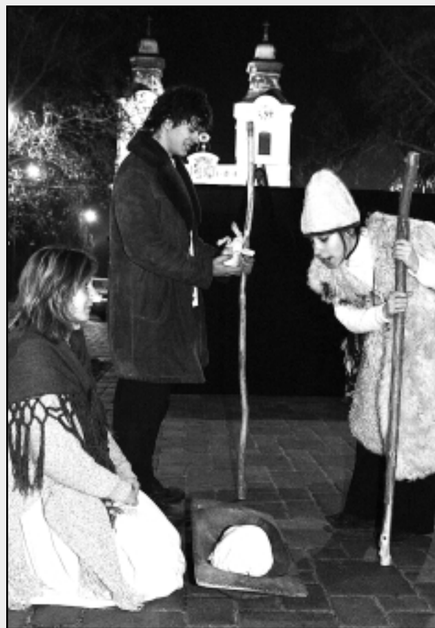
A SZÍNHÁZ TÁRSULATA KARÁCSONY ELŐTT BETLEHEMES JÁTÉKOT MUTATOTT BE