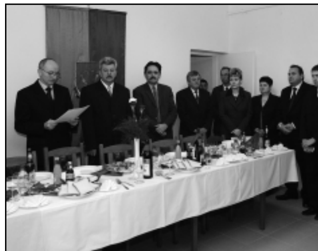
ÜNNEPÉLYES KERETEK KÖZÖTT AVATTÁK FEL A FALUHÁZAT

A falu új közösségi házának rekonstrukciója során javították a tetőszerkezetet, a homlokzatot, nyílászárókat cseréltek ki, a mozgáskorlátozottak