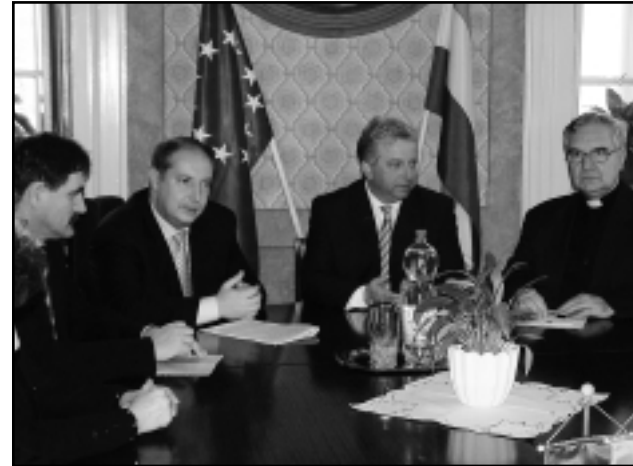
AZ EGYKOR KOLOSTOR SORSÁRÓL EGYEZTETTEK A TÁRGYALÁSON