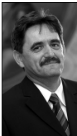
a Magyar Szocialista Párt jelöltje