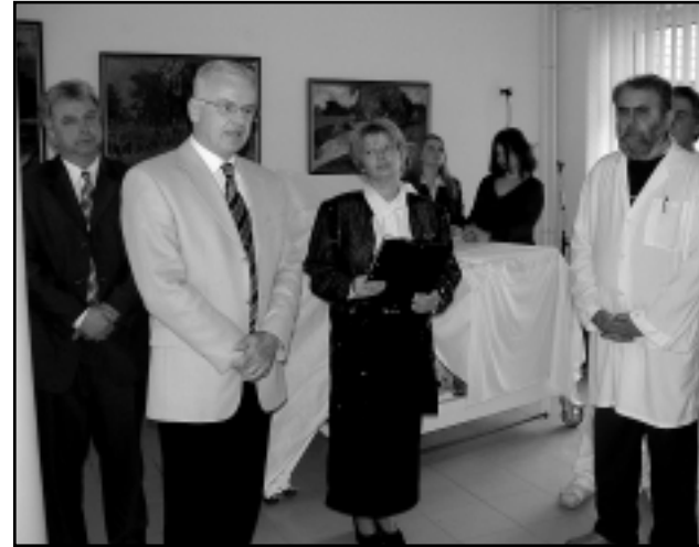
A CIVIL EGYESÜLET NEM ELŐSZÖR ADOMÁNYOZOTT A KÓRHÁZNAK

Az elnökasszony kiemelte: azok a nők, akik gyermeket vállalnak, sok esetben egzisztenciájukat, szakmai előmenetelüket kockáztatják, vagy éppen egyetemi, főiskolai tanulmányaikat szakítják meg. Mindezek ellenére vállalják a gyermekáldást a nem kevés lemondással, szenvedéssel és küzdelmekkel együtt. Tisztelet jár ezért nekik. Megérdemlik a tiszteletet és köszönetet azok is, akik fáradtságos munkájuk gyümölcseinek egy részét e közös ügyért, nemes cél érdekében ajánlották fel. Az adományozók: a kistérségi társulási tanács, a celldömölki és egyházasheteyi önkormányzat, vállalkozók és magánszemélyek között ott található a szülészeti osztály valamennyi dolgozója is. Az adakozók közül többen személyesen jelen voltak az átadási cere-