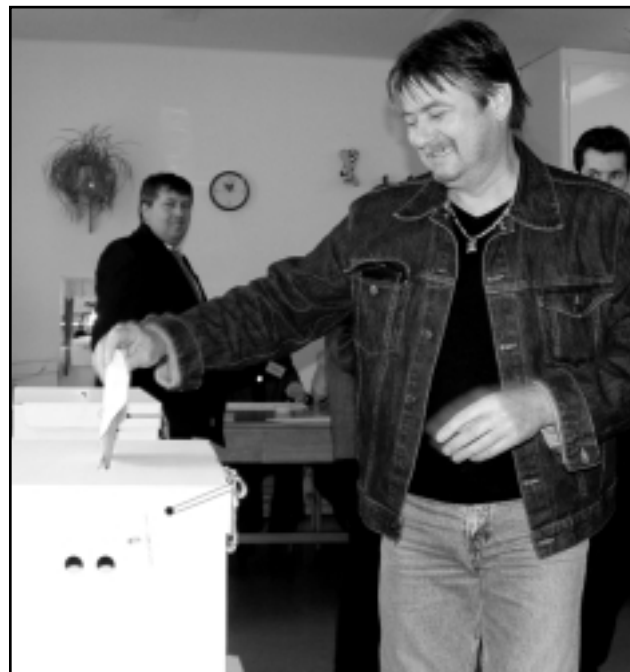
CELLDÖMÖLKÖN AZ ORSZÁGOS ÁTLAG FELETTI VOLT A RÉSZVÉTELI ARÁNY