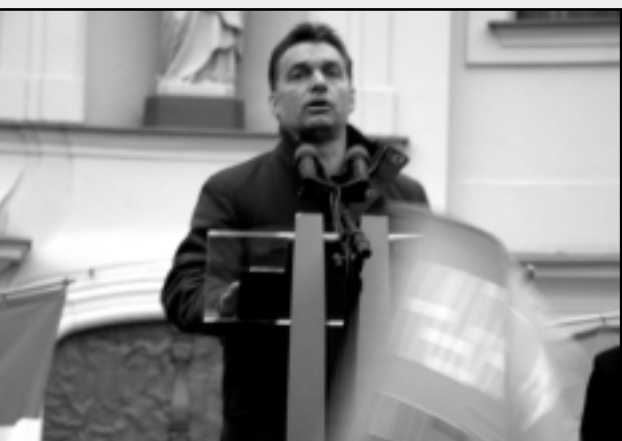
ORBÁN VIKTOR PÁRTELNÖK A GYŰLÉSEN

Választási gyűlést tartott Celdömölkön Orbán Viktor, a Fidesz – Magyar Polgári Szövetség miniszterelnök-jelöltje április 3-án. Az ellenzéki párt elnöke Vas megyei látogatása során Szombathely és Kőszeg után érkezett a városba. A katolikus templom előtti téren több ezer szimpatizáns várta a politikust.