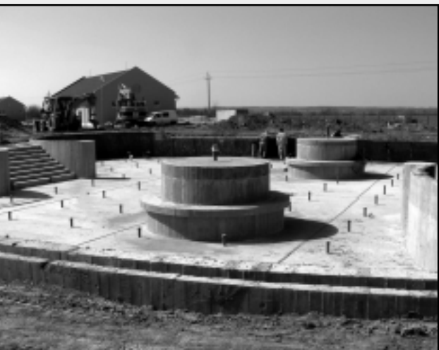
ÉPÜLNEK A VULKÁN FÜRDŐ SZABADTÉRI MEDENCÉI