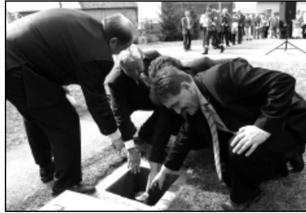
A KÓRHÁZ TERÜLETÉN ÉPÜL A MENTŐÁLMOMÁS

A város első embere köszönetet mondott Szabó Lajos országgyűlési képviselőnek is, aki sokat lobbizott azért, hogy a beruházáshoz megszerezzék a szükséges forrást. Szabó Lajos köszöntőjében arról szólt: azért kell dolgozniuk, hogy az egészséges emberek tisztességes körülmények között élhessenek. Kiss Péter kancelláriaminiszter üdvözlő beszédében kiemelte: így épül az Új Magyarország, ahol összefogás és akarat van, ott a kormánynak segíteni kell, hátteret, forrást kell biztosítani. Szólt arról is, hogy Vas megyében a szombathelyi mentőálmomás, a bevetési központ, illetve a celldömölki létesítmény kialakításával európai színvonalú mentőellátás és sürgősségi ellátás alakul ki. A helyi mentőszolgálatok lefedik a megyét, országosan pedig több száz mentőautót osztottak szét, illetve osztanak szét a közeljövőben.