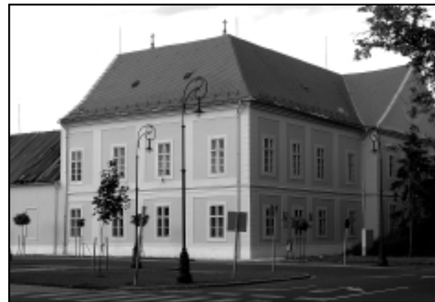
SZÉPEN FELÚJÍTOTT ÉPÜLETET KAP VISSZA AZ EGYHÁZ

ják a művelődési központ elé építeni a polgármesteri hivatalt önálló épületként. Azonban ha az önkormányzat nem talál – a műemléki szempontokat is figyelembe véve – más helyszínt, akkor elképzelhetőnek tartják a Dr. Géfin téren az építést, de a művelődési központtal egy épülettömbben. Az iroda elsősorban azonban a jelenlegi polgármesteri hivatal és a templom által határolt tér északi oldalára – a kis park, a volt hangyabolt helyére – javasolja az építkezést. A Vas Megyei Építész Kamarától érkezett levélben Ábrahám Ferenc okleveles építészmérnök, elnök által írtak szerint mindkét helyen megvalósíthatónak tartják az épületet. Azt javasolják, hogy a kettő közül választ-