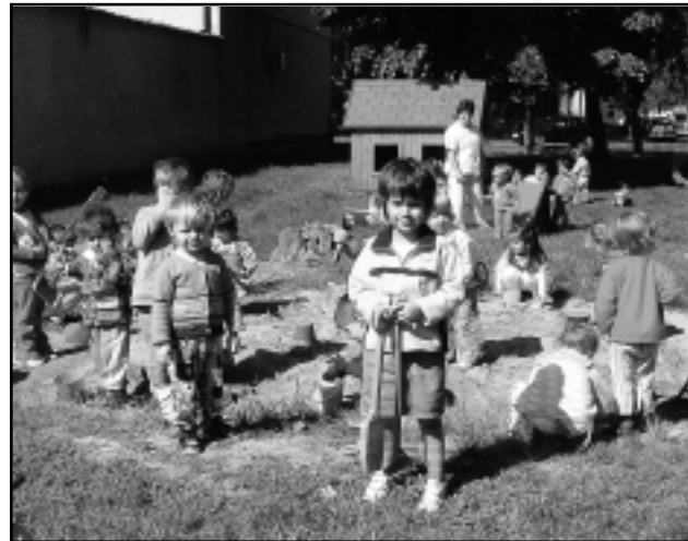
KÖSZÖNTJÜK A KISEBB-NAGYOBB GYEREKEKET, FELVÉTELÜNKÖN A BÖLCSŐDÉSEK

1950 óta május utolsó vasárnapja a nemzetközi gyermeknap, melyet a világ legtöbb országában ünnepnek. A magyar költők gyerekekről szóló verseiből válogatott idézetek füzérével köszöntjük mi is a gyerekeket.