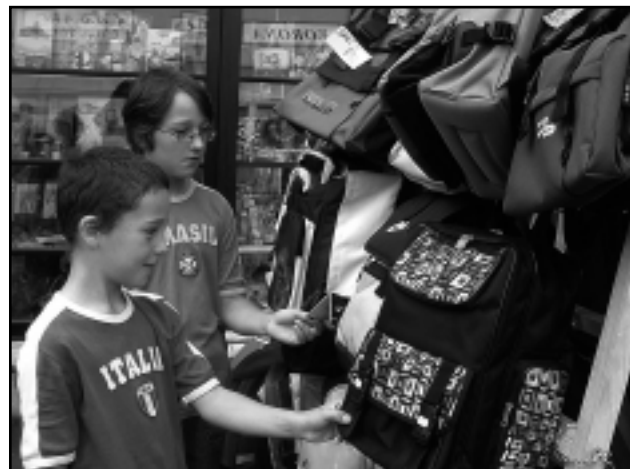
TANÉVKEZDÉSRE KÉSZÜLNEK A DIÁKOK

Az iskolakezdés nagy felelősséget ró pedagógusra, szülőre egyaránt. Mivel a szülők állnak érzelmileg legközelebb a gyermekekhez, ők nagyon sokat tehetnek az iskolakezdési stressz feloldásának érdekében. Be kell látnunk azonban, az érzelmi dolgokon túl, nem könnyű az ő helyzetük sem, hiszen mindenki a legjobbat szeretné gyermekének biztosítani, s ez anyagiilag nagyon megterheli a családot. A „De nehéz az iskolatáska...” kezdetű dal szinte szó szerint érthető. Az iskolakezdés – nemcsak az első osztályokban – átlagosan 10-20 ezer forintba kerül gyermekenként. Ezt próbálja ellensúlyozni az iskoláskorú gyermekek után tanévkezdésre járó dupla családi pótlék, illetve a hátrányos helyzetben lévő gyermekek iskolakezdési támogatása, melynek