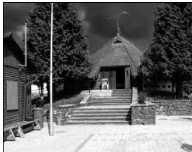
AZ ÁTALAKÍTÁS SORÁN TÉRKÖVEZTÉK A TÁBOR TERÜLETÉT