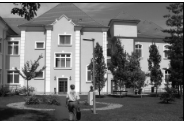
A KÓRHÁZ EGYIK FELÚJÍTOTT ÉPÜLETE