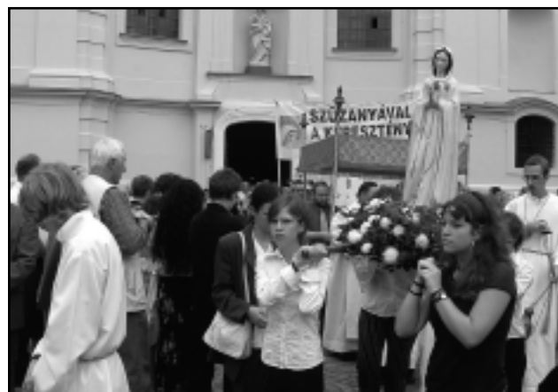
BÚCSÚSOK EGY KORÁBBI MÁRIA-BÚCSÚ ALKALMÁBÓL

A fiúk 13–14, a lányok 15–16 éves koruktól vehettek részt a menetben. Első alkalommal búcsúi keresztapát, keresztanyát választottak. A nagy menetben elől haladtak az idős férfiak, őket a legények, leányok, majd az asszonyok csoportja követte. Az egyes csoportoknak külön zászlói voltak. A lányok-asszonyok zöld színű zászlóját is felváltva vitték, de falvakban vagy kegyhelyeken áthaladva mindig olyan fiatalasszony vitte, akinek farsangkor volt az esküvője. A hatnapos út során Bodajkon, Szapáron, Nagygyirmóton, Celldömölkön volt éjszakai szállás. Faluhe-