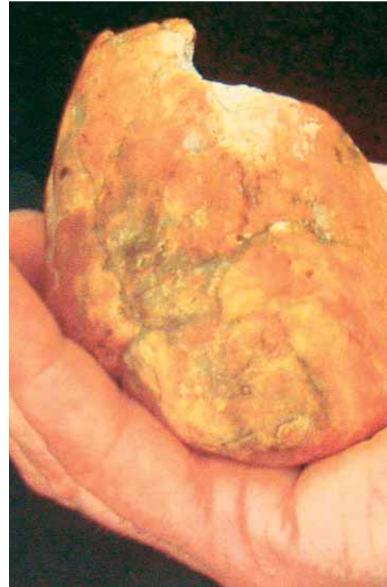
A KÜLÖNLEGES KŐ

– Ha az ember nem hobbiként, szenvedélyesen végzi a munkáját, akkor belefárad, beleöregszik. A titok az, hogy több hobbid is legyen. Nekem az orvoslás is, a barkácsolás, a köveim is, de a főzés is mind a hobbi kategóriába tartoznak, az egyikről a másikra térek. Az orvosi munka talaja a tudomány. Az eszköze már inkább a művészet. A levegője a szeretet.