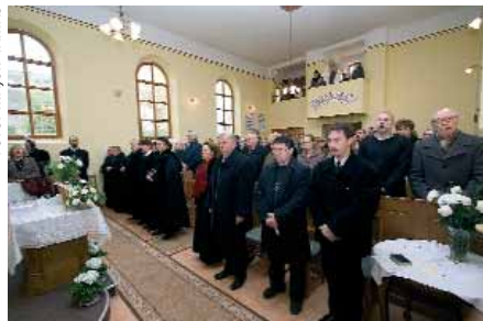
A FELÚJÍTOTT TEMPLOMBELSORÓ ÉS AZ ÜNNEPLŐK