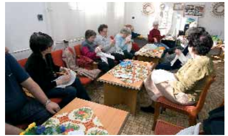
A KÉZIMUNKA-SZAKKÖR TAGJAI