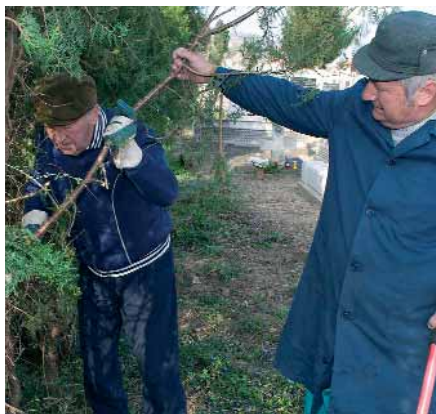
MEGSZÉPÜLT A SÁGI TEMETŐ