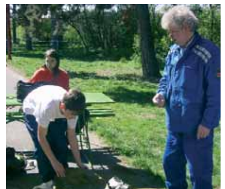
SZÁMOS ÉRDEKES FELADATOT OLDOTTAK MEG A TANULÓK