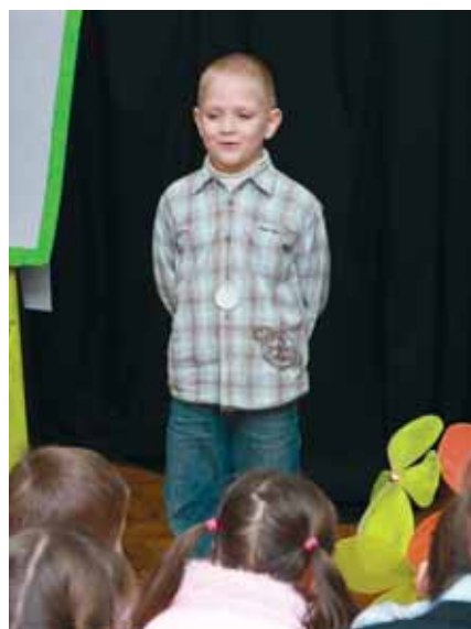
A VERSMONDÓ VERSENY EGYIK RÉSZTVEVŐJE

Az eredményhirdetés után a Tücsök Bábcsoporthoz tartozó műsorát tekinthették meg a részt-