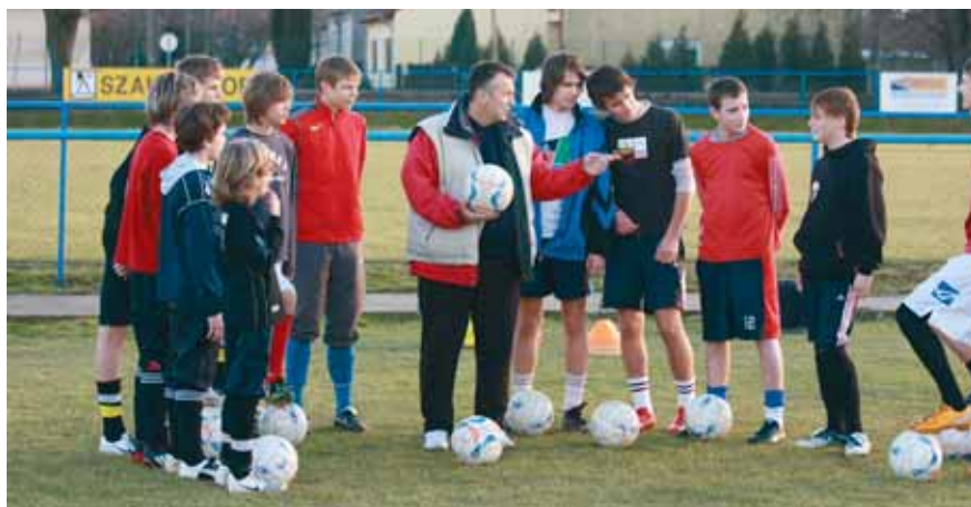
AZ UTÁNPÓTLÁS CSAPAT EDZÉS KÖZBEN

mind a felnőtt, mind az utánpótlás-csapatok tekintetében nem várt sikeres szereplést hozott az ősszel. A felnőtt csapat a negyedik helyen telelt, és ha az ősi utolsó fordulókban még kitartott volna a játékosok koncentrációja, bizony meg lehetett volna a dobogó valamelyik foka is. Így is, – messze nem pejoratívan használva a kifejezést – a legjobb amatőr együttes lett a csoportban, mert az előttünk álló Veszprém, Hévíz és Lipót együttese kiemelkedik lehetőségeiket tekintve a mezőnyből. A télen ezek az együttesek tovább erősödtek, rengeteg edzőmeccset játszottak és nem titkolt célja egyik csapatnak sem, hogy a következő szezont akár egy osztállyal feljebb kezdje meg. A Cellnek ebben a szezonban természetesen nem kell egy esetleges kiesési veszély miatt idegeskednie, nem célja a feljutás sem, ugyanakkor egyet nem tehet meg: szürke középcsapattá válni. Arra, hogy ez nem következik be, garancia a szakosztályvezetés és a játékosok eddig megismert, megszeretett győzni akaró mentalitása. Ezt a szezont ennek a csapatnak arra kell felhasználnia, hogy