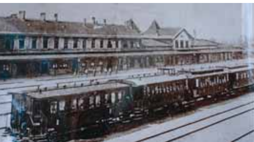
A KIS-CZELLI VASÚTÁLLOMÁS ÉPÜLETE

– Alapítása törvénybe volt iktatva, az 1869. évi 5-ös törvény foglalkozott ezzel, amely a Magyar Nyugati Vasútépítés tárgyában lett kiadva. Ez tartalmazza a nyugati vasút engedélyokmányát, ennek az okmányoknak az 5-ös paragrafusa magában foglalja a következőket: „A kis-czelli elágazási állomás az utazó közönség szükségének megfelelőleg étkezésre berendezendő.” Törvény írta tehát elő, hogy itt, Kiscellben az étkezésre is alkalmas létesít-