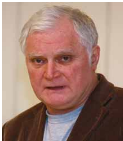
AZ EST VENDÉGE

Második témakörként összehasonlította az 1995-ös és 2009-es évet. Eddig a rendszerváltás legrosszabb időszakait jegyezték az 1995-ös esztendő, a Bokros-csomag időszakát. A jobb- és baloldali vélemények megoszlottak és megoszlanak az időszakot illetően. Kéri szerint azért van ekkora véleménykülönbség, mert nem volt kellően megmagyarázva, milyen következményekkel járt volna az 1995-öt követő időszak, ha nincs a Bokros-csomag. Sok volt akkor is a sztrájk, de