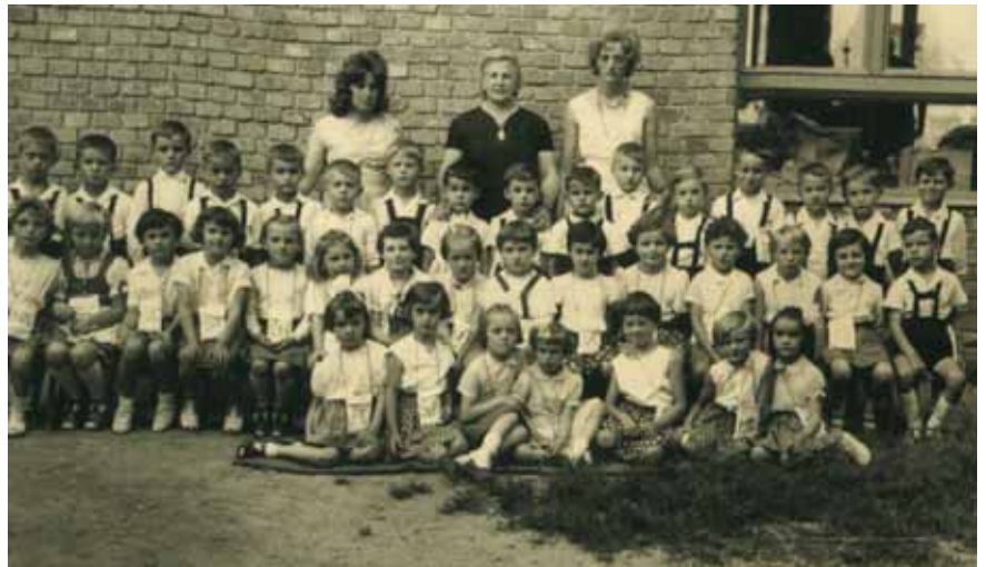
ÓVODAI CSOPORT 1962-BŐL

Az 1945 utáni években egyre több családanya vállalt munkát, ezért jogos igényként merült fel az óvodaépítés gondolata a