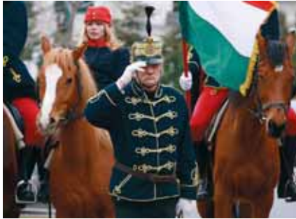
A 11-ES HAGYOMÁNYÓRZÓ HUSZÁRBANÉRIUM IS RÉSZT VETT AZ IDEI MEGEMLEKÉZÉSEN

Többen reménykedtünk, hogy majd talán március 15-re szép tavaszi időnk lesz. Főként a verőfényes szombat után hittük, hogy a vasárnap is hasonlóan napsütéssel kényeztet bennünket, de nem így lett. Változékony, szeles, felhős-esős időjárásra váltott március 15-e. Az 1848–49-es forradalom és szabadságharcra való emlékezés az időjárással dacolva méltó módon zajlott. A Himnusz elhangzása után Vörösmarty Mihály: Szabad