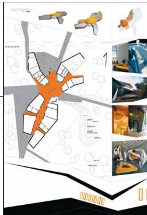
A HARMADIK HELYEN OSZTOZIK A CET BP. KFT ÉS A HALIMAN KFT. BUDAPEST