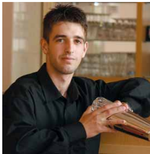
MILÁN MUNKA KÖZBEN

» Mint koktél-szerviz cég, kitelepüléseket is vállaltok. Milyen rendezvényeken lehet megtalálni benneteket?