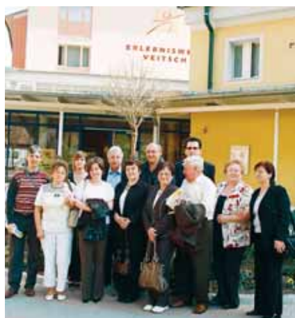
A VÁROSI KÜLDÖTTSÉG AZ OSZTRÁK VEITSCH-BEN

– A JUFA Családi, - és Ifjúsági Szállodalánccal az önkormányzatunknak már három éve van kapcsolata. Már akkor jártak itt, hogy megnézzék a fürdőt és a körülötte lévő területeket egy esetleges szálló építése céljából. A képviselő-testületnek az volt az eredeti elképzelése, hogy egyben adja el a hasznosítható földterületet, ahol egy három-négy csillagos szálloda épülhetne sportpályával, illetve kempinggel együtt. Ez a tervünk eddig nem realizálódott, így újra elkezdődtek a tárgyalások a JUFA-val. Ennek a cégnek azóta is az az elképzelése, hogy a fürdő mellett nem több, mint egy egyhektáros területet ve-