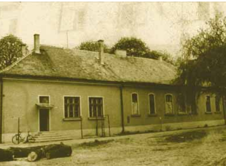
A BELGYÓGYÁSZATI OSZTÁLY FÉRFI RÉSZLEGE 1987-BŐL

ezenkívül egy-egy gyermekgyógyász és fül-orr-gégész szakorvos letelepítéséhez kértek az Orvosok Szabad Szakszervezetétől segítséget. Ennek megfelelően 1946-ban a törvényhatóság már a szülész-nőgyógyász rendelő-főorvosi állás szervezése mellett foglalt állást.