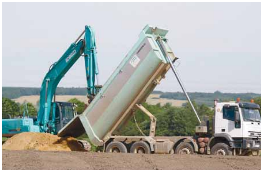
JAVÁBAN FOLYNAK A MUNKÁK AZ EGYKORI HULLADÉKLERAKÓ HELYÉN

ra hivatott, hogy a szelektív hulladékgyűjtést, -szállítást, -lerakást hosszú távon korszerű módszerekkel megoldja. Ami kevésbé ismert a nagyközönség előtt, hogy ennek a közel 7 milliárd forint értékű projektnek része – úgy is mondhatnánk, befejező üteme – a korábbi legális és illegális hulladéklerakók, szeméttelpek ártalmatlanítása, rekultivációja, visszahelyezése a természetbe. Ennek a rekultivációs projekt-ütemnek részese Celldömők is két telephellyel: a korábbi szeméttelpeken, a Pápai úton és Alsóságon a Fazekas Mihály utcában a kialakult illegális hulladéklerakó helyén. A közbeszerzési eljárás során a generál-kivitelezés jogát a budaörsi székhelyű Green Network Kft. nyerte el.