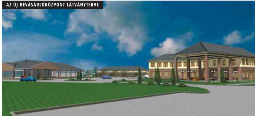
AZ ÚJ BEVÁSÁRLÓKÖZPONT LÁTÁNYTERVE