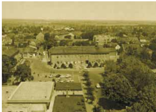
AZ EGYKORI TANÁCSKÖZTÁRSASÁG TÉR A KILENCMELETES LAKÓHÁZRÓL NÉZVE

A városá avatás az infrastruktúra tekintetében nem azt jelentette, hogy elkészült a mű, megpihenhet az alkotó, hanem inkább tekinthető volt egy biztatásnak, hogy jó úton indult el egy fejlődési folyamat (elsősorban inkább a humán infrastruktúra tekintetében), illetve figyelmeztető jelzés volt, hogy egy városhoz nem méltó a műszaki infrastrukturális állapot. Valóban voltak új lakótelepek, új családi házas övezetek, voltak munkahelyek, kialakult a bölcsődei, óvodai, iskolai hálózat, a művelődési ház. Nagy dolgok ezek, ma is megbecsülendő dolgok, de rengeteg dolog nem volt a helyén: a szakmunkásképzés, a szakorvosi ellátás helyzete és például a zeneiskola elhelyezése. A katolikus templom előtti téren a műemléki környezetben autóbuszok parkoltak, főleg ha két gödör között elfértek, a Szentháromság (akkor még Tanácsköztársaság) téri park inkább hasonlított egy labirintushoz a kalandparkban, mint egy pihenő funkciójú díszparkhoz a városközpontban. A lakások mintegy kétharmada volt csak rákötve a vezetékes vízhozálóra, mintegy 20%-ában kerti csapból, a többiben az utcai közfolyókról, vagy sa-