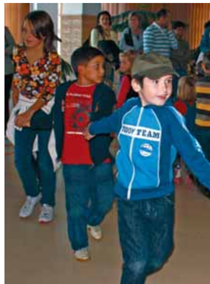
A NÉPTÁNC ALAPJAIVAL ISMERKEDHETEK MEG KICSIK ÉS NAGYOK

Jó volt hallani, hogy ezen az októberi vasárnap délutánon gyerekszívajtól volt han-