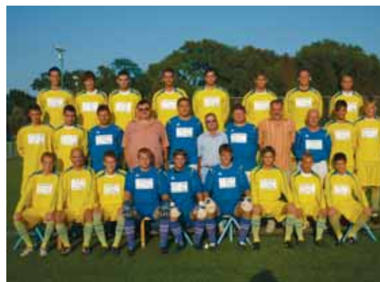
A CVSE FELNŐTT LABDARÚGÓCSAPATA