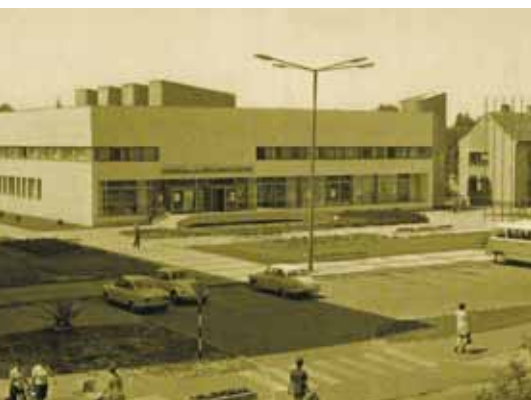
TANÁCSKÖZTÁRSASÁG TÉR – A KMK ÉS A KÖNYVTÁR

nyeket, amelyek az emberek életének szebbé tételét, megkönnyítését szolgálják. Ha ma valaki a Ság hegyről pillantást vet Celldömölkre, a lakótelepek közül a templom magasságát meghaladó kilencemeletest látja kiemelkedni, amely büszkén hirdeti: Kemenesalja népe új életet teremtett.” (Kálmán Jenő: Múlt, jelen, jövő).