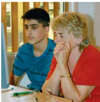
A GYÓZTES NAGYI-UNOKA PÁROS

– Október 8. és 11. között ingyenes beiratkozási lehetőséggel vártuk azon ötven év felettieket, akik még nem voltak könyvtártagok, és újonnan beiratkozottként regisztráltatták magukat. Ezt a lehetőséget 26-an vették igénybe, egyébként a három napon összesen 86 új felhasználóval bővült a könyvtár használóinak köre. Jelenleg 2060 regisztrált felhasználót tudhatunk tagjaink között, ebből kb. hatszázra tehető az ötven év felettiek száma. Az idősebb ko-