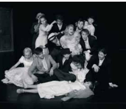
PILLANATKÉP AZ ÁLOMEVŐK CÍMŰ ELŐADÁSBÓL

rendelkezésre állt a személyzet is, hiszen számos olyan ember akadt Sitkén, aki tudott hegedülni, citerázni, cimbalmozni, így zenés darab színrevitelére is lehetőség nyílt. Fűtetlen teremben próbáltunk, színpad nélkül, mégis lelkesen. 1980 nyarán a sárvári művelődési központban kaptunk helyet a próbákra, ekkor készült el az első produkciónk, a Ludas Matyi , de ez még nem került közönség elé. Az első bemutatónk Labiche: Ilyen a világ című darabja volt, 1980 szilveszterén. A Sitkei Színkör első, zsűri elé került produkciója 1982-ben született. Ekkor már némi sárvári és gércei kitérdő után újra Sitkén volt a székhelyünk. Hosszú időn keresztül (1985-ig) úgy működtünk, mint egy átlagos falusi csoport, létrehoztunk egy darabot, kétszer-háromszor eljátszottuk, és újabbá fogtunk. 1986 volt az az év, amikor az addigi tapasztalatok, élmények alapján tudatára ébredtünk, hogy nem lehet tovább időtöltésként felfogni a színjátszást. Ettől kezdve hatékonyabban, szervezettebben, nagyobb előadásszámmal és immár két – gyermek- és felnőtt – tagozattal folytattuk tovább. Szintén '86-ban határoztunk úgy, hogy egyesületi formában szeretnénk működni, ez