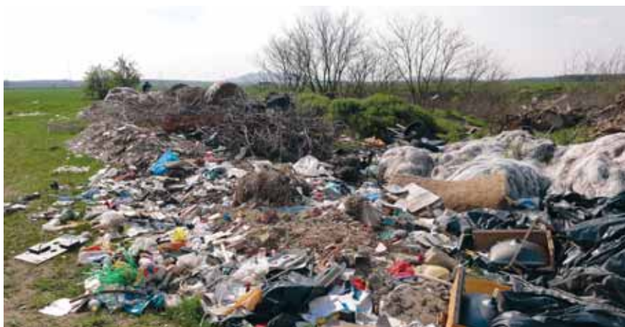
ILLEGÁLIS HULLADÉKLERAKÓ A KISMEZEI ÚT MELLETT

Itt egy számítógép monitor, amott meg egy fél pár cipő. A másik fele vajon melyik bokor alatt lapul? Az úton tovább haladva a Kemenesi Tájéoló című lap tavaly májusi számával találkozunk. Na, nem egy szélfútt példánnyal, hanem több százzal, gondosan kötetelve. Érdekes módja ez a remittenda elhelyezésének. Távolabb építési törmelék la-