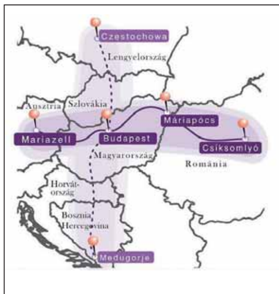
A MÁRIA-ÚT PROJEKT KÉT FŐ ÚTVONALÁNAK KERESZT ALAKÚ RAJZOLATA

esett szó. A Mária-út egy hét országra szóló projekt, amely behálózza egész Közép-Európa zarándokútvonalait. Európában ehhez hasonló egy működik: a spanyolországi Szent Jakab-útja, a Camino. És mivel ma Nyugat-Európában minden harmadik ember lelki indítatásból kel útra, ezért látnak nagy lehetőséget ennek kialakításában. A Camino útvonalát 20 év alatt megszászorozták: nyilván a zarándokok az útvonal mentén található egyéb értékeket is megismerik. A Mária-út végighúzódik mindazok mellett a települések mellett, amelyek a Mária-kultuszt ápolják. Nem mellékes, hogy az útvonalak mentén ki kell alakítani a zarándok-szálláshelyeket. Ezek lehetnek különböző komfortfokozatúak, de legfontosabb, hogy a fáradt vándor valahol el tudjon fogyasztani egy tál ételt, ki tudja tisztítani ruháit, és egy éjsza-