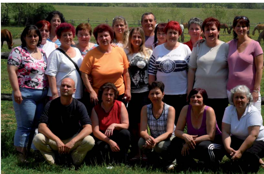
AZ EGÉSZSÉGÜGYI DOLGOZÓK ELSŐ VÉGZŐS CSAPATA

A Kemenesaljai Egyesített Kórház több mint 30 millió forint összegű uniós támogatást nyert egészségügyi dolgozói képzésére. A projekt keretében összesen 129 fő képzése valósul meg, ebből 126-an stresszkezelési és regenerációs tréningen vesznek részt, hárman pedig egészségügyi szakképesítést szereznek, a részvételi arány magas, mintegy 90%-os. Az egészségügyi dolgozók az éves kötelező képzések során a szakmaspecifikus és a jogszabályi változásokat ismerhetik meg, de a betegekkel illetve hozzátartozóikkal való bánásmód oktatásá-