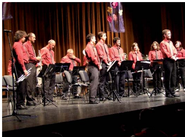
A MURASZOMBATI FÚVÓSOK IS SZÍVESEN TÉRNEK VISSZA VÁROSUNKBA