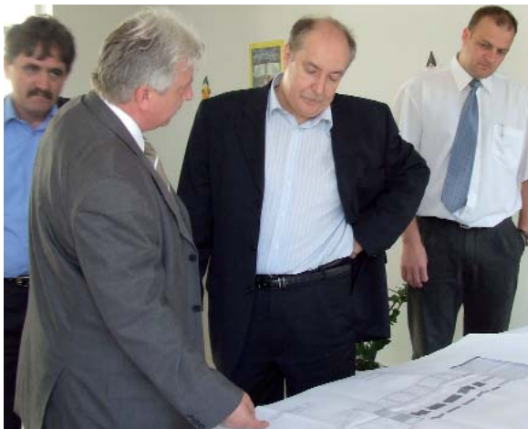
A VÁROSI ÁLTALÁNOS ISKOLA TERVEI IS ELŐKERÜLTEK A LÁTOGATÁSKOR