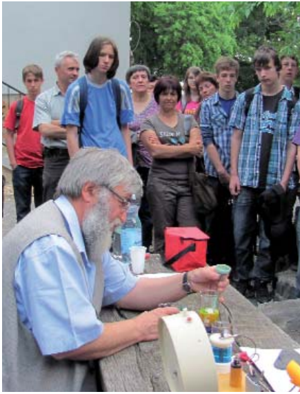
FIZIKAI KÍSÉRLETEK A SZABADBAN