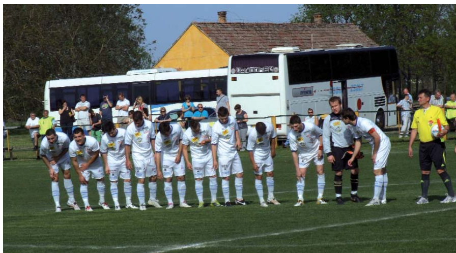
ÖT MECCSEL A VÉGE ELŐTT HAT PONT AZ ELŐNYE A CSAPATNAK