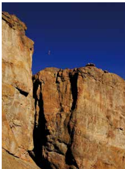
A HIGH LINE MAGASÁN