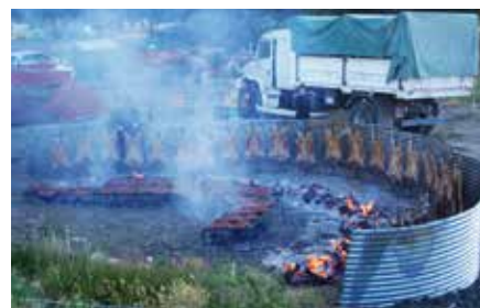
ASADORES ÉS PARRILLA

amit a parázs fölött szintén megsütnek. Minden mindegy alapon jól belakmározunk belőlük utolsó esténken. A hazaút