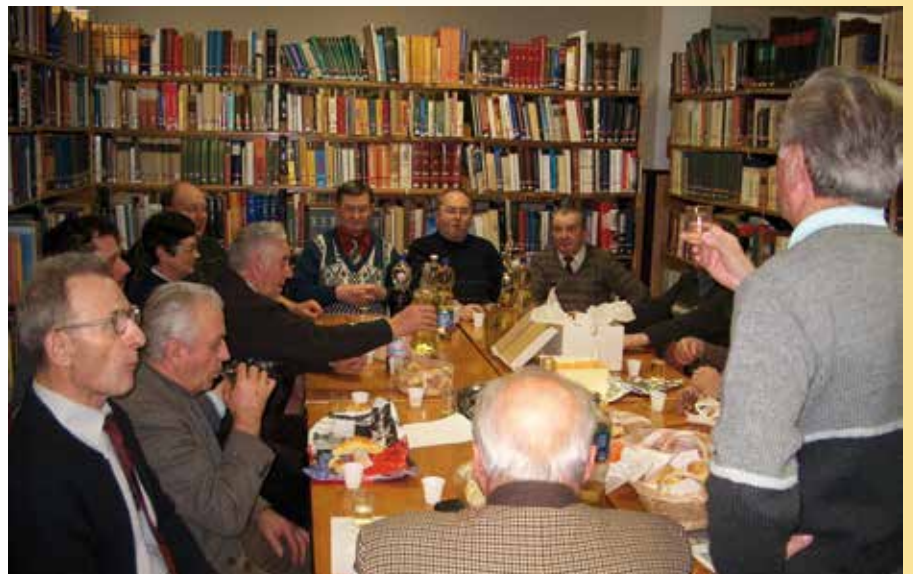
ÉVZÁRÓ FOGLALKOZÁS 2006-BAN