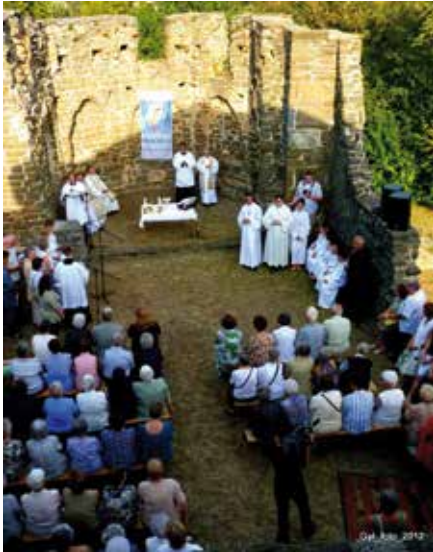
SZABADTÉRI SZENTMISE A DÖMÖLKI ROMTEPLOMBAN