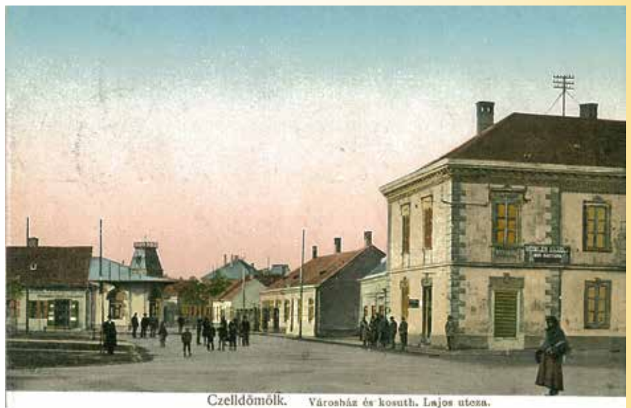
Celldömölk. Városház és kosuth. Lajos utca.