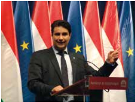
AZ EST SZÓNOKA MESTERHÁZY ATTILA VOLT

Megyei kampánynyitó rendezvényét tartotta március 21-én Celldömölkön a Magyar Szocialista Párt. A politikai naggyűlés vendége Mesterházy Attila, az MSZP elnöke, országgyűlési frakcióvezetője volt, aki a kormánypárt munkáját is értékelte a teltházas közönség előtt.