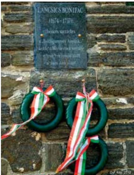
LANCICS BONIFÁC EMLÉKTÁBLÁJA