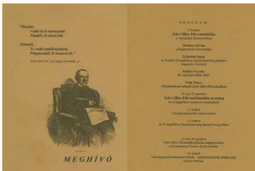
AZ EDVI ILLÉS PÁL EMLÉKÉRE RENDEZETT PROGRAM HIVATALOS MEGHÍVÓJA

Reméljük, lesznek követőink, bár az érdeklődés ma kisebb, mint szeretnénk.