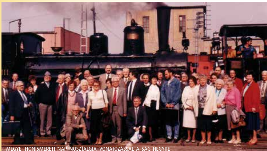
MEGYEI HONISMERETI NAP NOSZTALGIA-VONATOZÁSSAL A SÁG HEGYRE

mert az ott elhangzottak gyarapítják tudásomat, élményeimem. Szívesen emlékezem a már elhunyt tagjainkra, akiknek távozása nagy űrt hagyott bennem is. Volt módomban elutazni néhány országra, ahol sok szép dolgot láttam, tapasztaltam. Ezek a maradandó emlékek számomra.