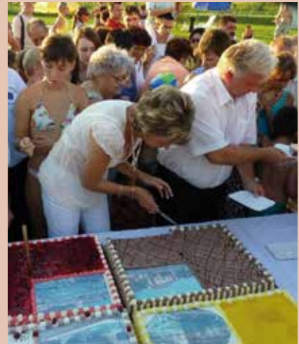
A FÜRDŐ SZÜLETÉSNAPIJÁT MINDEN ÉVBEN ÓRIÁSTORTÁVAL ÜNNEPLI

a második szakaszban az élmeny-medence és a kisgyermekmedence épült meg, így azóta már 1600 négyzetméter vízfelület várja a látogatókat. Az összberuházás elérte a 2,2 milliárd forintot. A létesítmény termálfűtője 1245 méter mélyről nyeri a „Celli Vulkán Gyógyvizet”, a gyógyvízzé minősítés után a létesítmény a Vulkán Gyógy- és Élmenyfürdő nevet vette fel.