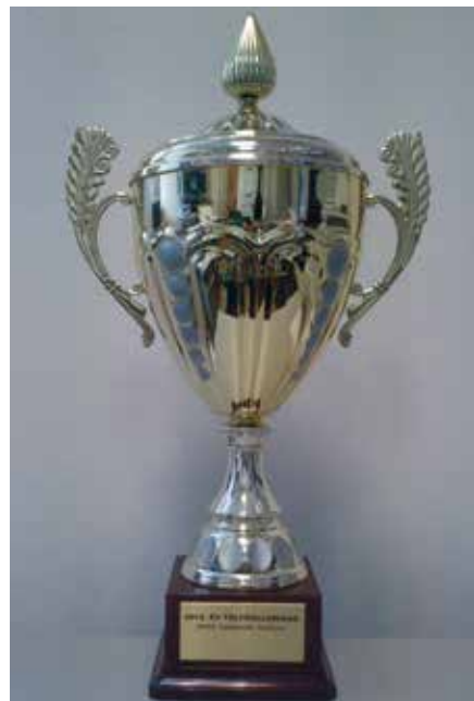
A KIVÁLÓ MUNKA EREDMÉNYE

– Nyilván ez komoly munkát igényel, hiszen a versenyképesség megtartásához a piaci változások gyors felismerése és az azokhoz való alkalmazkodás szükséges. Fontosnak tartom, hogy termékeinkről és szolgáltatásainkról mindenkor pontos és valószínűleg megfelelő információt közvetítsünk, versenytársainkkal szemben tisztességes üzleti magatartást ta-