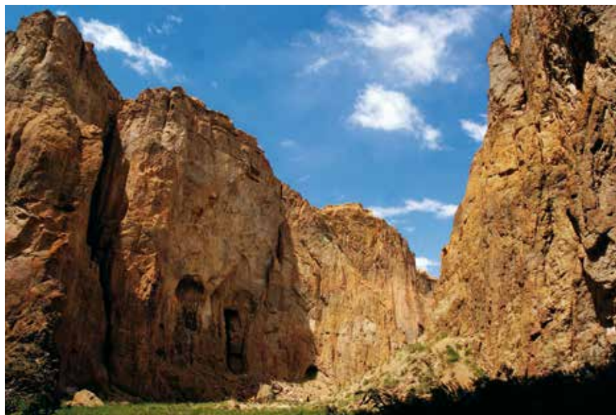
A VULKANIKUS KANYON

érdekesen alakult. A Petzl team buszával utazhattam egy darabig, aztán végül egy taxival érkeztem meg Barilochéba. A közlekedési szabályok rugalmasak arrafele, ezért többször volt halálfélelmem, amit tovább fokozott, hogy női sofőrt kaptam. Barilochéban végül megtapasztalhattam, hogy milyen lehet egy luxus nyaralás. Egy fantasztikusan szép hotelben aludhattam, fürödhettem, hiszen valószínű e nélkül fel sem engedtek volna a repülőre. Délutáni kávézás a főutcán, esti csapolt mézsörözés, vacsorázás egy pub-ban. Buenos Airesben volt még egy kalandos taxizásom a két repülőtér között. Hosszú sor a taxira várásnál, spanyol nyelvű sofőr, korlátozott anyagi források. Végül nem is lett volna elég a pesom az utolsó kilométerre. Elég