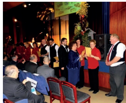
LISZT FERENC VEGETESKAR