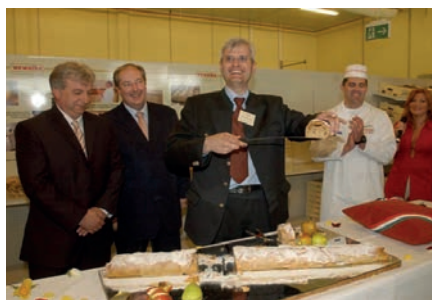
A WEWALKA KFT. TÍZ ÉVE TELEPÜLT IDE, AZÓTA TÖBBSZÖRÖSÉRE NÖVEKEDETT A FOGLALKOZTATOTTAK LÉTSÁMA

környékét. Felújításra került a bölcsőde épülete, és mintegy 90 millió forintos pályázati finanszírozásnak köszönhetően újulhatott meg a Vörösmarty utcai tagóvoda is. A Koptik utcai tagóvoda új csoportszobával bővült, az alsósági tagóvodában pedig nyílászárócsere történt. Jelentős beruházás volt 2012-ben a tanműhely építése, mely által a 21. századi elvárásoknak megfelelően sajátíthatják el a tanulók a szakmai gyakorlat alapjait.