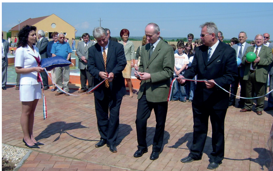
A VULKÁN FÜRDŐ ÉS A HOZZÁ KAPCSOLÓDÓ IDEGENFORGALMI FEJLTSZÉSEK VONZÓ CÉLPONTTÁ TETTÉK CELLDÖMÖKÖT

Kiemelt cél volt a városközpont megújítása. 2004 őszén került átadásra a biztonságosabb közlekedést szolgáló körforgalom, valamint a posta előtti tér a városközpontban. Ezt a projektet 200 millió forint állami támogatásból sikerült megvalósítani. A város későbbi fejlesztéseit már ehhez igazították. 2007-ben 435 millió forintos összköltségvetésből sikerült felújítani a Ke-