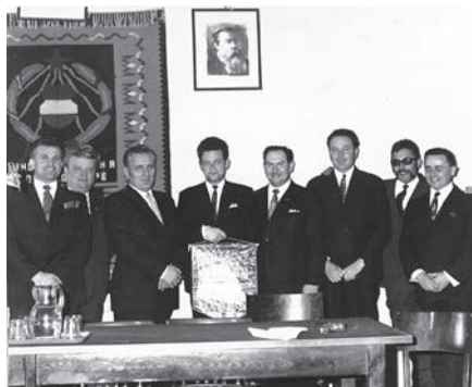
AZ AUTÓKÖZLEKEDÉSI VÁLLALATNÁL

– Folytatni a település fejlesztését, együtt élni és szolgálni a lakosságot. 1973-ban megrendeltük Celldömölk általános rendezési tervét, amit 1975-ben hagyunk jóvá. Ez a városfejlesztés irányát foglalta keretbe. Ennek eredményeképpen is a Sági útról ki tudtuk telepíteni a három ipari szövetkezetet: a Celltalexet, a Műszaki Ipari Szövetkezetet, és az Építőipari Szövetkezetet az ipartelepre. Ezek helyét lebontottuk, és még a hetvenes évek második felében a helyükre lakásokat tudunk építeni, alattuk üzletsorral, a volt Nemzeti Bank épületétől a Lázár-házig. Ekkor épült a 150 adagos Ság hegy Étterem is, ami minőségi előrelépés volt az akkor már meglévő vendéglátóegységekhez viszonyítva. Elkészült a kenyérgyár, átadva régi helyét az iskolakonyhának, átadásra került a tizenhat tantermes is-