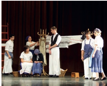
MESEDARABOKKAL SZÓRAKOZTATTÁK A KÖZÖNSÉGET