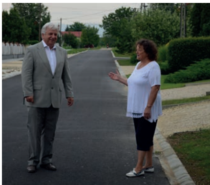
ELKÉSZÜLT A BOCSKAI UTCA MUNKÁLATAINAK ELSŐ ÜTEME