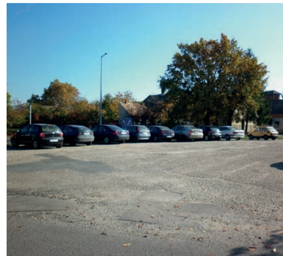
SZABÁLYOZOTTABBÁ VÁLIK A DÓZSA U.-RÁKÓCZI U. PARKOLÓJA

esztétikailag illeszkedjen a városközpont-hoz. Egy, a lombzatával, virágzásával, díszítő vadkörte-fajtát és ezüst hársakat, valamint intenzíven virágzó rózsabokrokat ültetünk. Hulladékgyűjtőket valamint utcabútorokat is helyezünk ki: előbbit végig a Kossuth utcán, valamint a vasútállomás épülete előtt, utóbbit pedig a vasútállomás elé, hogy az utazó közönség nagyobb kényelemben tölthesse el a várakozási időt.