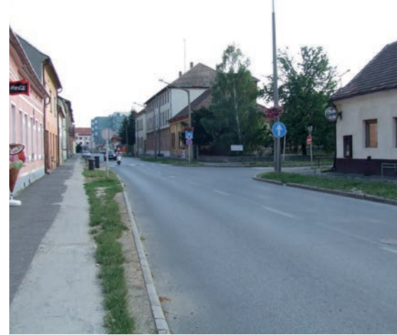
KERÉKPÁRÚT IS KÉSZÜL A KOSSUTH UTCA MINDKÉT OLDALÁN

»Többet nehezményezik a fák kivágását... – Igen, én is, a kollégáim is és a képviselő-testület minden tagja a látszat ellenére a fák oldalán áll. Az ott lévő japánakác fasor hátralevő élettartama jóval kevesebb volt, mint lesz a körülötte lévő megújuló műszaki létesítményeké, ráadásul a kivitelezés során a szétterülő gyökérzet óhatatlanul sérült volna, tovább rontva a fák életéselyeit. Most, az építkezéssel egyidejűleg van arra reális esély, hogy úgy ültessünk el egy új fasort, aminek realitása van arra, hogy a következő 50-60 évben értékes, szép része legyen az utcának. A projekt része a parkosítás is és összességében több fát fogunk ezen a területen ültetni, mint amennyi kivágásra került. Igyekezünk úgy megtervezni a vasútra való rávezető útszakaszt, hogy