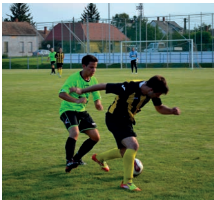
CELLDÖMÖLK-SÁRVÁR MAGYAR KUPA MÉRKŐZÉS

Rögtön az első fordulóban összecsapott az elmúlt idény ezüstérmes hazai csapata és a vendég bronzérmes csapat, így nagyon fontos mérkőzést