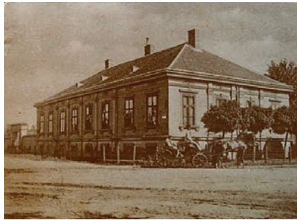
AZ ARATÓ-HÁZ EREDETI ÁLLAPOTÁBAN

Ismét befejeződött egy régi épület felújítása a Király János utca végén. Városunk nem bővelkedett építészeti kiemelkedő épületekben, a második világháború okozta károk után még kevesebb maradt. Ezért is fontos egy régi, városképileg értékes épület felújítása és főként használatba vétele.