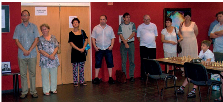
A SAKKVERSENY NÉVADÓJÁNAK CSALÁDTAGJAI, VALAMINT A VERSENYZŐK ÉS KÍSÉRŐIK LÁTHATÓK