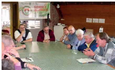
VÉLEMÉNYEK, ÉSZREVÉTELEK, JAVASLATOK, KRITIKÁK AZ ELŐADÁSOKON ELHANGZOTTAKHOZ

Az Alkoholizmus Elleni Megyei Egyesületek és Klubok Országos Szövetsége Regionális Fórumát szervezte meg a celldömölki Új Barátok Alkoholizmus Elleni Egyesület Balatonrendesen, a városi ifjúsági táborban május 22-24-én. Az előző évek rekreációs táborozása helyett a fórum 2015-ben az alkoholizmusról, a civil önszervező közösségek szerepéről, szervezettefejlesztéséről és hálózatépítéséről szolt.